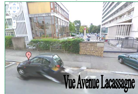
Vue Avenue Lacassagne