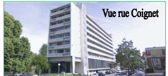
Vue rue Coignet